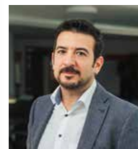
Tuna Ucgun Reha-Tagesklinik Psychosomatik und Reha-Tagesklinik für Abhängigkeitserkrankungen